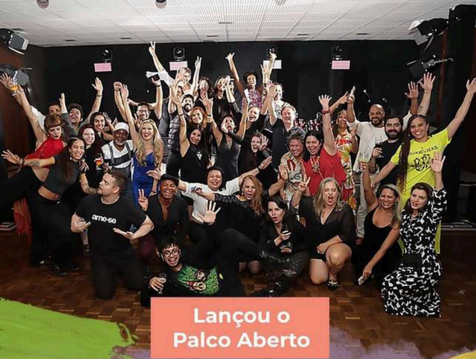
Lançou o Palco Aberto

...com aumento de 6% para os servidores, pago em fevereiro de 2024.