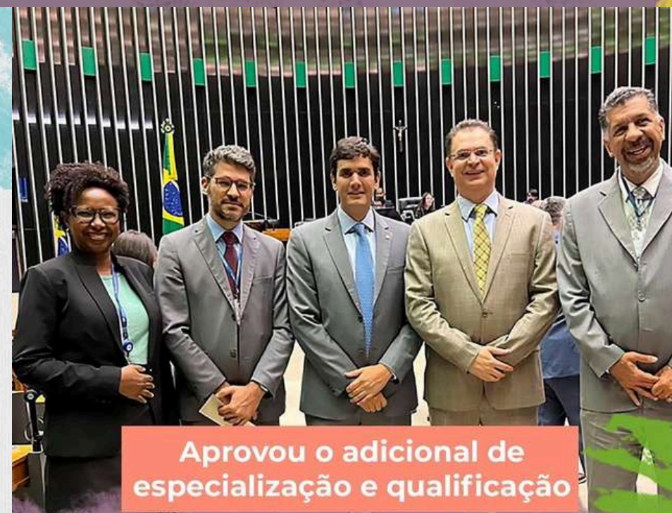
Aprovou o adicional de especialização e qualificação

...garantindo segurança jurídica para servidores do Senado e da Câmara.