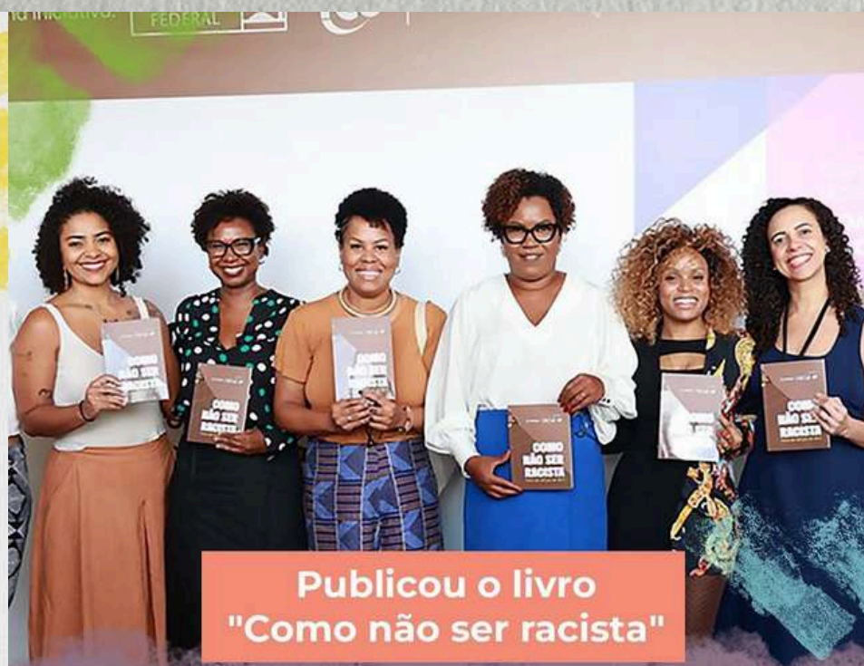
Publicou o livro "Como não ser racista"

...um projeto cultural que envolveu 80 servidores e familiares.