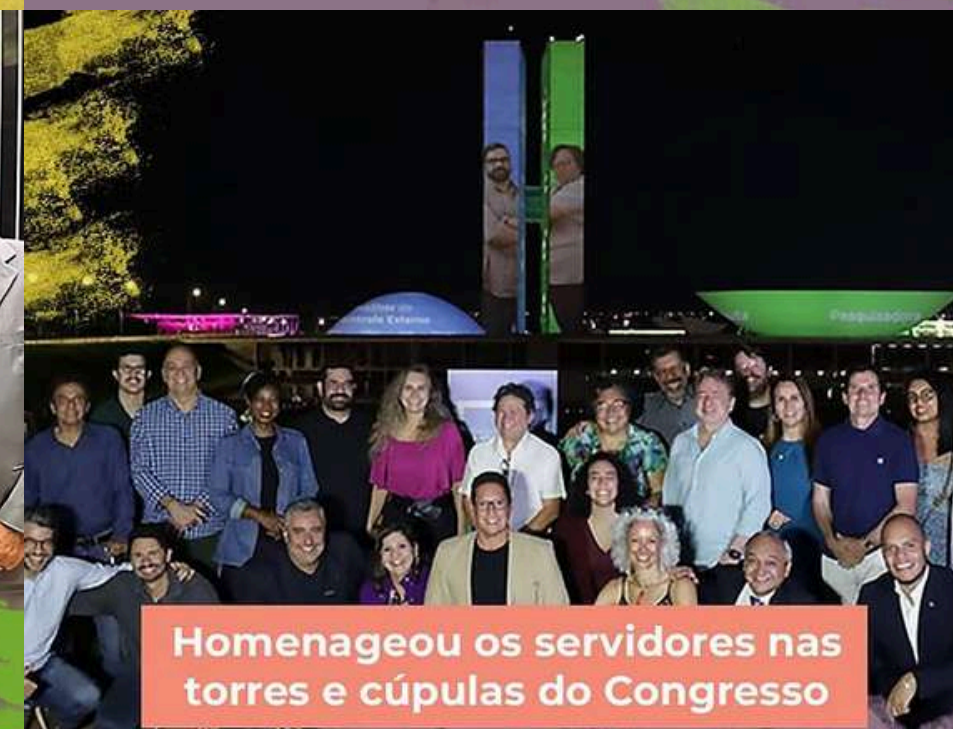
Homenageou os servidores nas torres e cúpulas do Congresso

...com mais de 500 servidores inscritos em clima de esporte e integração.