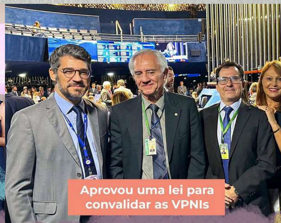
Aprovou uma lei para convalidar as VPNIs

... porque cuidar da saúde é prioridade.