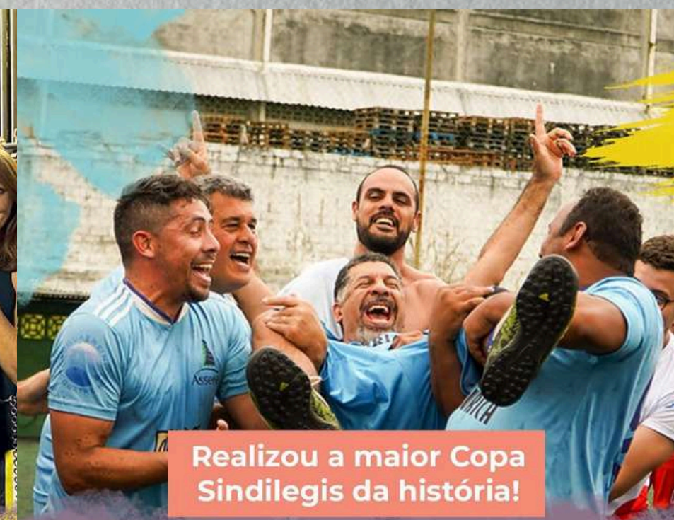
Realizou a maior Copa Sindilegis da história!

...para os servidores do Tribunal de Contas da União.